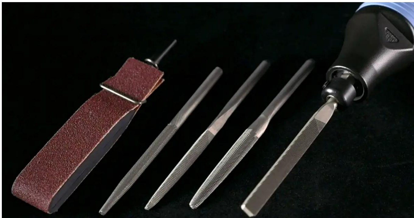
Różne warianty pilników z uchwytem 5 mm możliwych do zastosowania z pilnikarką Nitto Kohki ASH-900