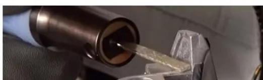
Przykłady zastosowań pilników do pilnikarek pneumatycznych

Dostępne inne warianty pilników - płaski, okrągły, trójkątny oraz uchwyt na papier ścierny